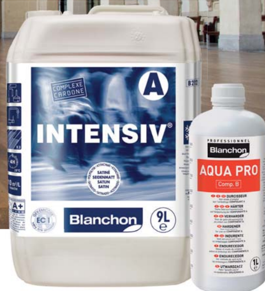
Composant B : Dangereux. Respecter les précautions d'emploi.

INTENSIV® 5L est livré dans un conditionnement spécial (carton séparable), directement utilisable pour le mélange et l'application.